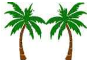
CRAL SAMARCANDA EMPOLI